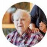
Juleglede for eldre