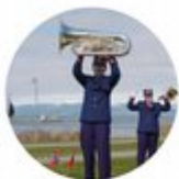
Korpsløft ga 17. mai-feiring