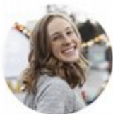
Støtte til studentaktiviteter