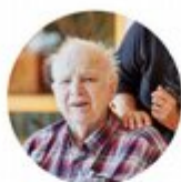
Juleglede for eldre