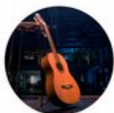
Stipender til kulturbransjen