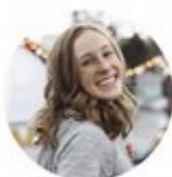
Støtte til studentaktiviteter