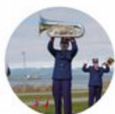
Korpsløft ga 17. mai-feiring