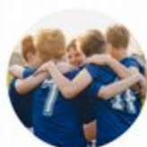
Krisehjelp til lag og foreninger

«SpareBank 1 SMN skal stimulere til en bærekraftig utvikling av Midt-Norge, gjennom å være en pådriver for grønn omstilling, partner for inkluderende samfunnsutvikling og veiviser for ansvarlig forretningskultur. Det skal vi realisere gjennom kontinuerlig forbedring av egen daglig drift og organisasjonskultur, utvikling av kundetilbudet vårt og ansvarlig disponering av samfunnsutbyttet»