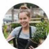
Sommerjobber til 750 ungdommer