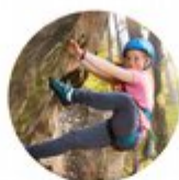
Støtte til sommeraktiviteter for barn